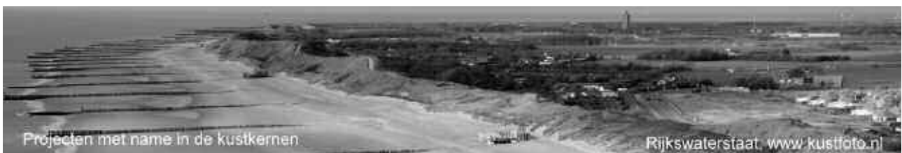
Projecten met name in de kustkernen

We benadrukken wel dat het realistische en haalbare plannen moeten zijn. Bovendien moeten we het als gemeente wel 'aankunnen' en moeten plannen ook een keer uitgevoerd worden. In schriftelijke vragen aan het college hebben we aangedrongen om tempo te maken met de plannen en ideeën van de denktank. Als je burgers mee laat denken, moet je er wel snel wat mee doen. We hopen dat we volgend jaar op de ledenvergadering een presentatie kunnen geven van 'Werk in uitvoering in Veere'.